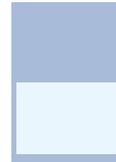
1/2 Seite (quer) 4-spaltig 190 × 134 im Anschnitt* 210 × 148 (+3 mm Beschnitt)