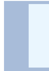
1/2 Seite (hoch) 2-spaltig 94 × 270 im Anschnitt* 104 × 297 (+3 mm Beschnitt)